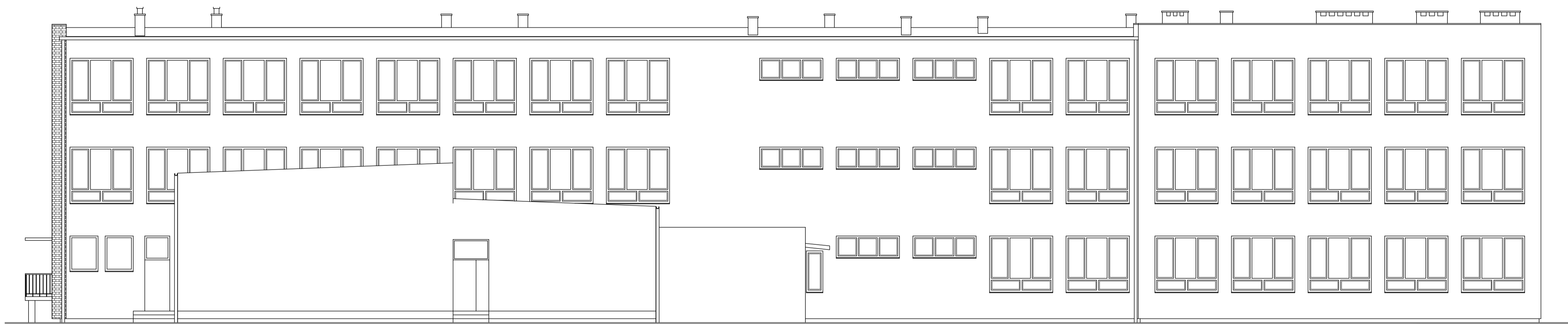
ELEWACJA WSCHODNIA SKALA 1:100