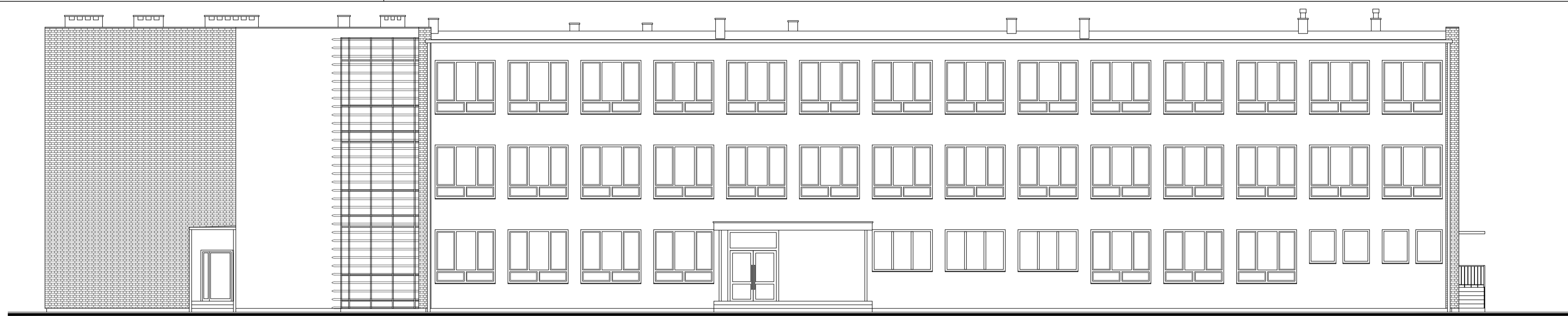
ELEWACJA ZACHODNIA SKALA 1:100